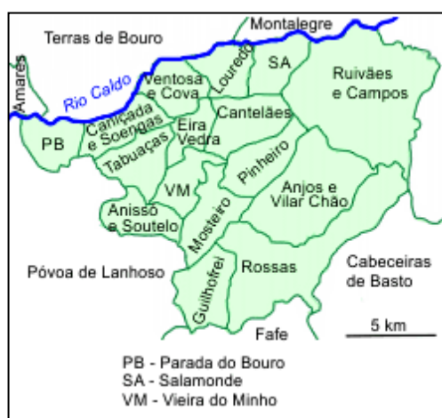
Fig. 1 - Mapa do concelho de Vieira do Minho.

Emoção e ternura por estas terras do concelho de Vieira do Minho que, segundo a mesma canção “Vai do Ave a Parada, de Soutelo a Vilarchão e desde Rossas à Ribeira...”. Mas, vai muito mais longe, de Guilhofrei a Campos, de Rossas a Caniçada, tocando os concelhos da Póvoa do Lanhoso e de Montalegre, de Fafe e Amares, de Cabeceiras de Basto e Terras de Bouro.